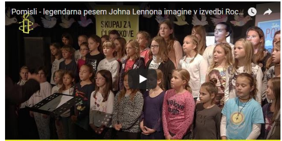
Učenci iz OŠ Nove Jarše ob izdaji slikanice Pomisli. Pridru...